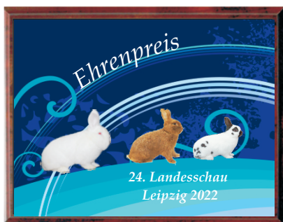
HAK 20 Ehrentafel 20,0 x 15,0 cm 13,95 € 22,5 x 17,5 cm 14,95 € 25,0 x 20,0 cm 15,95 €