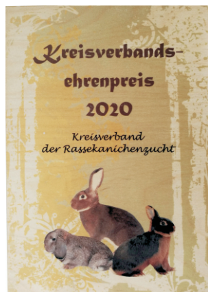
BHK Birkenholztafel 28,5 x 20 cm 18,95 €