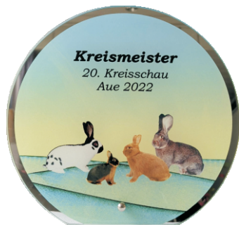
SK 173 Glasständer mit Spiegelglasrand 17 cm 17,95 €