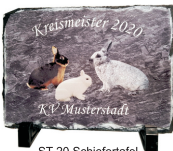
ST 20 Schiefertafel 15 x 15 cm 16,50 € 20 x 15 cm 19,95 € 20 x 20 cm 19,95 € 20 x 30 cm 29,50 €