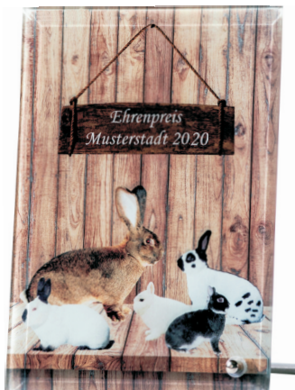
GHK 2019 Glasständer 15,0 x 10,0 cm 12,95 € 18,5 x 12,5 cm 14,95 € 22,5 x 17,5 cm 16,95 €