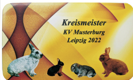
SK 25 Schneidebrett 14,0 x 23,5 cm lebensmittelecht, beidseitig bedruckt 15,95 €