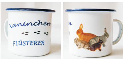
EK 70 Emailtasse 9,0 cm 450 ml 12,50 €