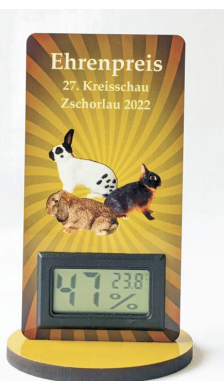
TK 20 Dig. Thermometer + Anzeige Luftfeuchtigkeit 6,0 x 12,0 cm 15,95 €